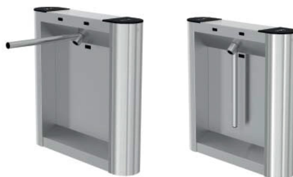
BAR ONE Unipod

Huset har täckpaneler i borstat rostfritt stål, toppsektionen i borstat rostfritt stål med plastkåpor i ändarna och armen är tillverkad i rostfritt stål.