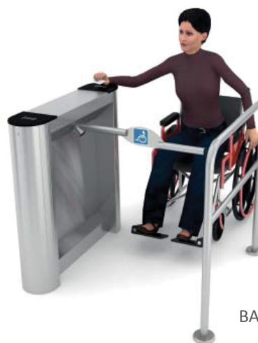
BAR ONE Gate