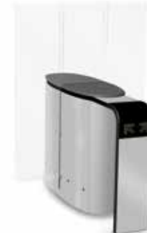
SmartLane 911 Twin med förhöjd ingångskontroll Footprint*: 1600 x 1450 mm