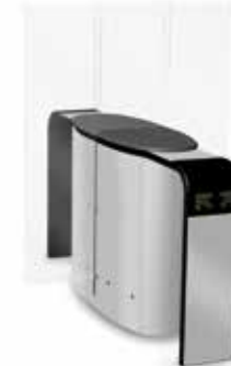
SmartLane 912 Twin förhöjd ingångs-/utgångs- kontroll Footprint*: 2000 x 1450 mm