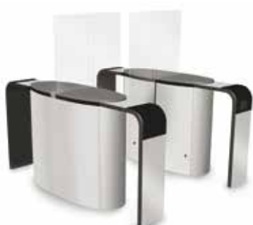
SmartLane 912 förhöjd ingångs-/utgångskontroll Footprint*: 2000 x 1800 mm)