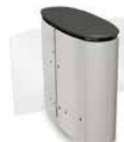
SmartLane 910 Twin med kompakta mått Footprint*: 1200 x 1450 mm