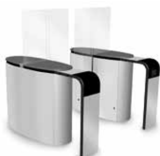
SmartLane 911 med förhöjd ingångskontroll Footprint*: 1600 x 1800 mm