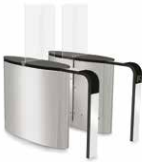
SmartLane 901 med förhöjd ingångskontroll Footprint*: 1600 x 1200 mm