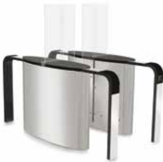
SmartLane 902 med förhöjd ingångs/ utgångskontroll Footprint*: 2000 x 1200 mm