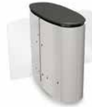
SmartLane 910 Twin med kompakta mått Footprint*: 1200 x 1450 mm