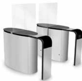
SmartLane 911 med förhöjd ingångskontroll Footprint*: 1600 x 1800 mm