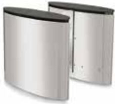
SmartLane 900 med kompakta mått Footprint*: 1200 x 1200 mm