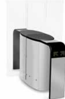
SmartLane 912 Twin med förhöjd ingångs/ utgångskontroll Footprint*: 2000 x 1450 mm