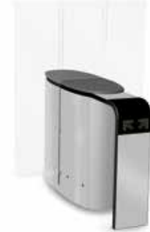
SmartLane 911 Twin med förhöjd ingångskontroll Footprint*: 1600 x 1450 mm