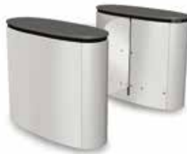
SmartLane 910 Footprint*: 1200 x 1800 mm