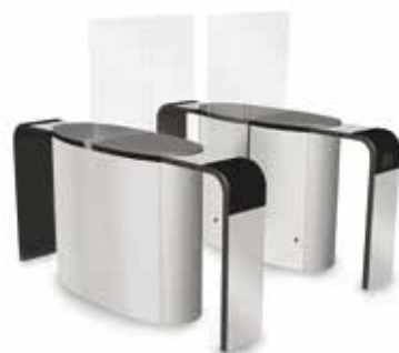
SmartLane 912 med förhöjd ingångs/ utgångskontroll Footprint*: 2000 x 1800 mm