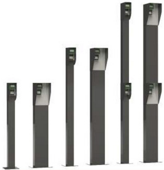
Pelare med regnskydd och monterad scanner.