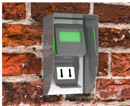
Scanner med regnskydd monterad på tegelvägg.

Betongfundament för infästning av pelare samt inkoppling och installation.