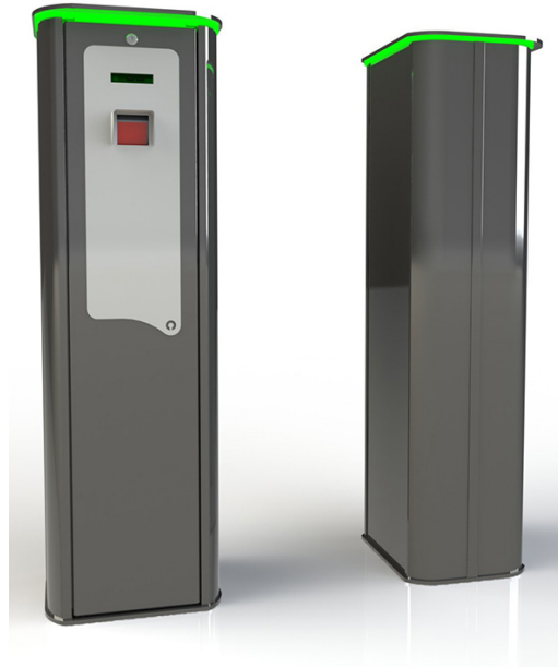
Bilden ovan visar en enhet extrautrustad med LED-ljus. Easy Access Pro finns i en rad olika utföranden, t ex med inbyggd skrivare.

Intergate kan leverera utrustning för accesskontroll med streckkodsläsare. Enheten kräver inga kablar, inget trådlöst nätverk.